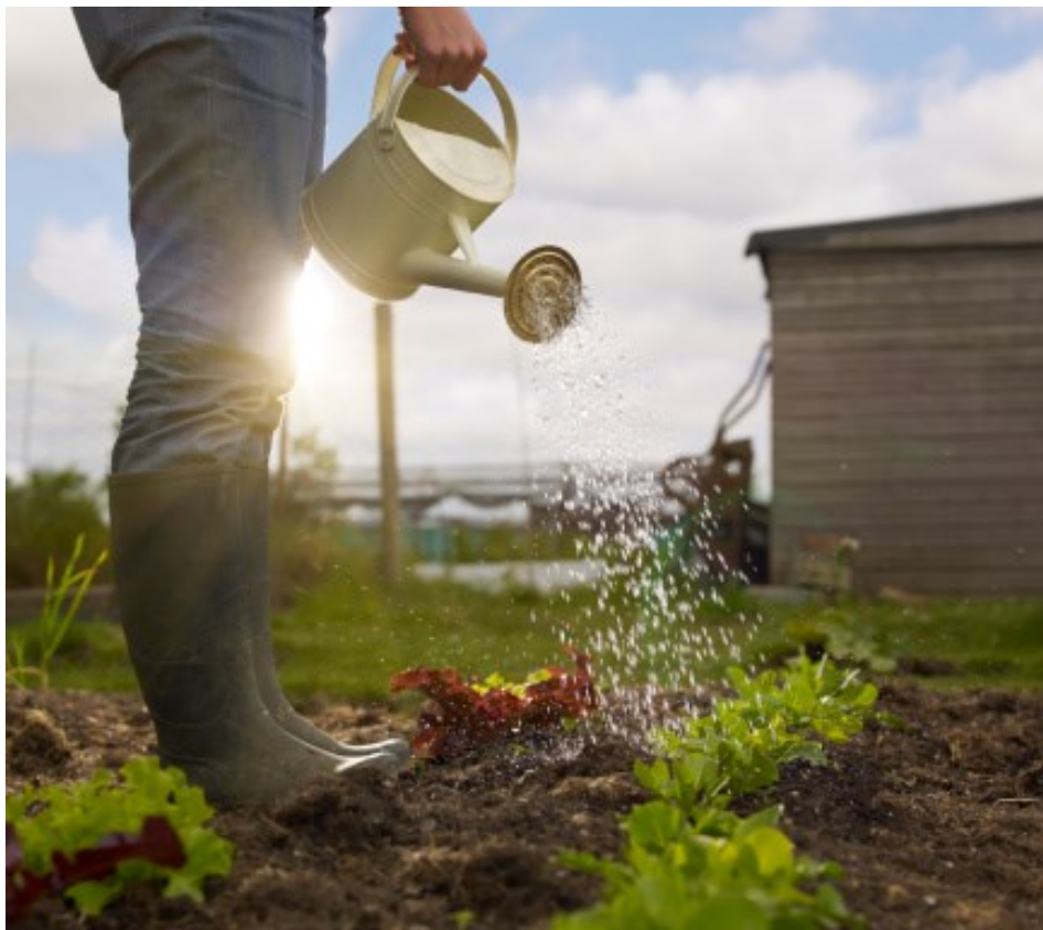
L'ORTO DI REBIBBIA

Formare personale alla conduzione dei mezzi agricoli e giardinag-